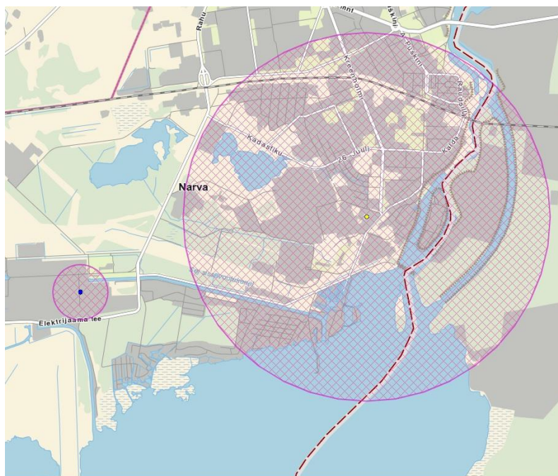
Väljavõtte Maaameti kaardiserverist